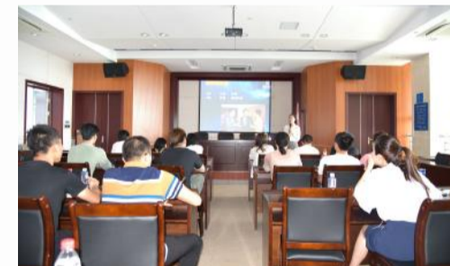
要求投入到工作中去，为恒尊事业的发展贡献自己的力量。(人力资源部)

本次培训旨在提升员工自身素质，激发工作热情，强化爱岗敬业的服务意识。不仅让新员工对恒尊集团有了全方位的了解，也为新员工的发展提供了相互交流的平台。同时进一步为新员工顺利实现自身角色转变，树立正确的工作理念和良好的工作态度，迅速融入恒尊工作环境奠定了基础。培训后，新员工们纷纷表示要以更饱满的热情、更高的