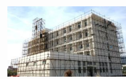
新墙体公司：在舟山高新技术产业园新注册成立“浙江恒尊新材料科技有限公司”，目前正在紧锣密鼓地开展建设。