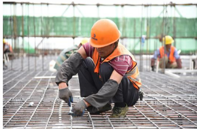
小钢筋撑起大家庭