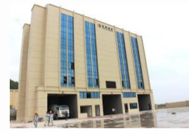
混凝土公司：新厂区搬迁至舟山高新产业园，已正式对外营业。