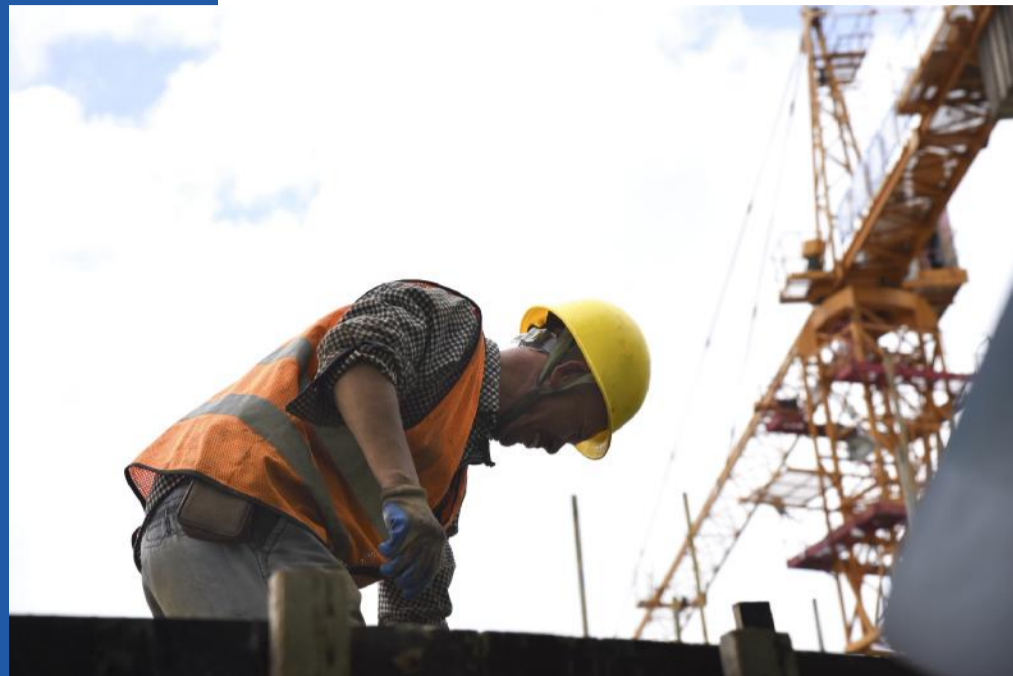
最接近天空的男人